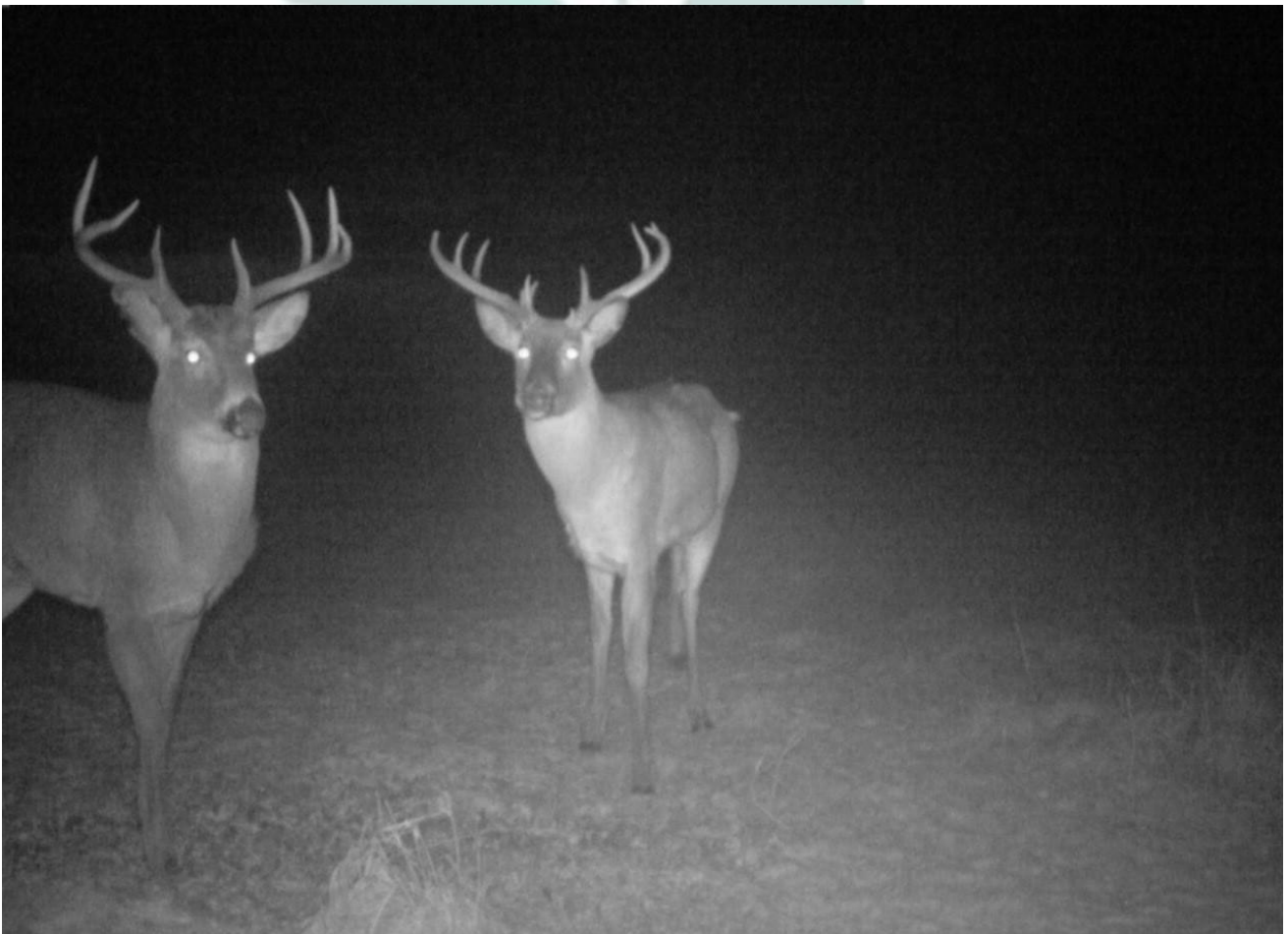
Kuvassa poseeraa Taivassalon pikkupojat